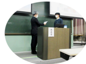
活動報告会にて優秀PJの表彰