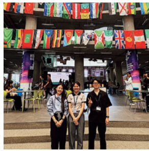
大学内のカフェテリア

今回のマレーシア留学は英語習得に加え、多民族国家ならではの多様な価値観に触れられる点に魅力を感じて決意しました。滞在中は異なる背景を持つ学生同士、互いの文化を尊重しながら関係を築く濃密な時間を過ごしました。特に印象的だったのは現地学生がアラブ料理を振る舞ってくれ、断食明けの食事「イフタル」を共にしたこととです。授業内のディスカッションでも文化の違いについて率直に意見を交わし、これまで馴染みのなかった国の友人ができたことで、その国を「訪れてみたい場所」として身近に感じるようになりました。また、多文