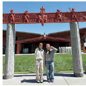
ワイカト大学のキャンパス内

出発前は航空機や滞在先などすべてが不安で、到着後3日間はストレスから喉が喉を通らないほどでした。しかし、ホストファミリーの「ここを自分の家だと思っけてリラックスして」という温かな言葉に救われ、一緒にテレビを見ながらつるつるぐほど打ち解けることができました。彼らからは日本について尋ねられることが多く、日本文化についてもっと知識があれば、よりスムーズに交流できたと感じています。また、英語がうまく伝わらず悔しい思いもしましたが、「単語を言うだけで会話は始まる」と気づいてからは、臆