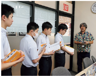
JTBデスク訪問 (キャリア教育)

グアムの歴史や文化のほか、安全性を高めるために街の整備やSNSの活用などさまざまな取り組みが行われていることを学んだ。