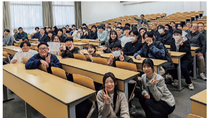
CLL活動を通じて実践的な学修に取り組んだ学生たち

ツの認知度向上に貢献した実績や、計8箇所の小学校および施設で実施した出前授業・講座の取り組みが紹介された。さらに戦略性を高めた種目「スクエアポッチャ」を初めて導入するなど、新たな挑戦を重ねながら活動を発展させてきた軌跡を報告。登壇した学生は、活動を通じて学内外のネットワークを築いただけではなく、主体性や協調性、コミュニケーション能力、問題解決能力を実践的に身に付けられたと手応えを語った。同プロジェクトはポスターセッションの言及が多かったことは印象深い。これらの力は、将来必ず大きな糧となる」と述べ、学生たちの実践的な学びの姿勢を高く評価した。