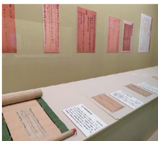
宮家の歴史を物語る至宝

企画展「和歌の諸相—時代による変遷を追って—」(10月6日)による変遷を追って—(10月6日)