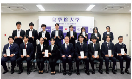
令和7年11月14日に行われた皇學館クラブ応援メッセージ募金授与式

メッセージの投稿が可能となっております。いただいた募金は指定されたクラブにお渡しし、投稿メッセージはクラブにお伝えしホームページでもご紹介させていただきます。詳細は右記二次元コードから公式ホームページ内の寄付金ページにてご確認ください。