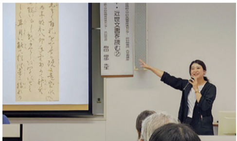
向学心あふれる受講者が集う古文書講座

紙媒体での刊行を行わず、本学の学術リポジトリのみの公開とし、多くの人に手軽に閲覧していただくことを望む。さらに必要となればデータを修正し、最新の史料集を提供することが出来るのも強みである。創立百五十周年記念の年の完成を目標に掲げて進めている。今後とも大方のご支援を乞う次第である。