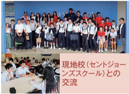
現地校(セントジョーンズスクール)との交流

太平洋戦争では日本のみならずアメリカ側もまた甚大な被害を受けた事実を展示物を通して再認識した。戦争とは単純に被害者、加害者と二分できるものではなく、双方がそれぞれの背景や事情を抱えていると理解できた。