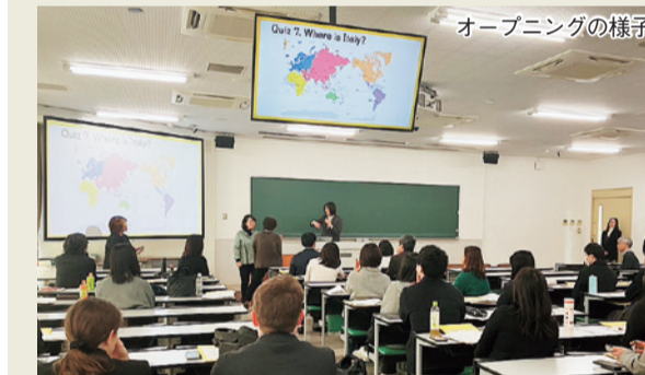
オープニングの様子

小学校外国語教育研究会 2026-1 in Mie (主催) / 小学校英語教育学会三重支部・三重県小学校英語教育研究会、後援/皇學館大学・三重県教育委員会・伊勢市教育委員会が1月24日に本学で開催され、小・中・大の教員や行政関係者、本学の学生ら53名が参加した。