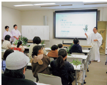
盛況を博した玉串作り

親子教室は「切り絵ランプを作ろう!」(7月26日)、「怪盗Sをさがせ!」(7月27日)の2企画を1日ずつ開催。小学生とその保護者65組169名にご参加いただいた。ワークショップは、「松阪もめんストラップを作ろう!」(8月31日)に34組72名、「玉串を作ろう!」(12月13日)に17組29名ご参加いただいた。(詳細は学園報第107号)