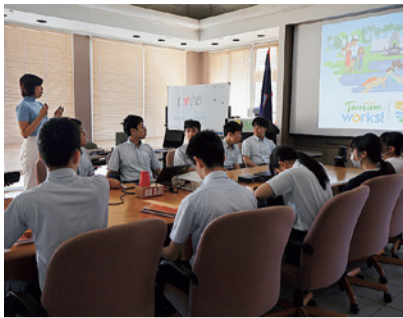
グアム政府観光局訪問 (文化理解)

グアムの歴史や文化のほか、安全性を高めるために街の整備やSNSの活用などさまざまな取り組みが行われていることを学んだ。