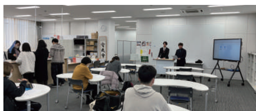
模擬授業ができる学習スペースは他の学生も自然と目に入る場所にある

また, 2025 年度には, 中学・高校の理科教員免許課程の設置に向けても準備を進めている。数学も理科も教員養成ができるようになれば, 次の飛躍のきっかけになりそうだ。