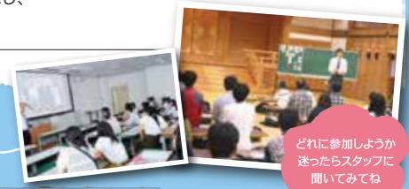
どれに参加しようか迷ったらスタッフに聞いてみてね