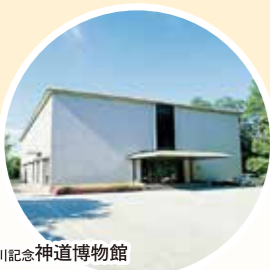
佐川記念神道博物館