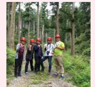
大紀町木のおも ちゃプロジェクト