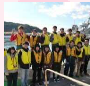
大紀町漁業活性化 プロジェクト