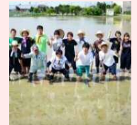
産学官連携日本酒 プロジェクト