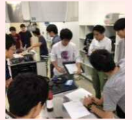
玉城産豚ブランド 化プロジェクト