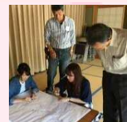
南伊勢町竈集落の 歴史文化の継承