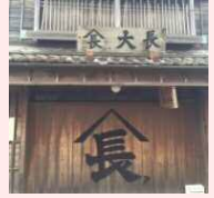
伊勢河崎商家 リノベーションプロジェクト