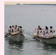
国崎二船祭 プログラム