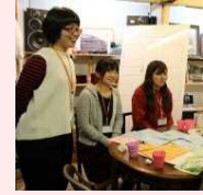
皇學館みらい 対話団