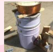
宿田曾吹ツトブ プロジェクト