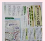
まちづくり新聞 編集プロジェクト