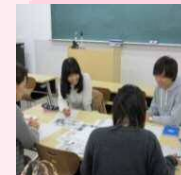
「ごみ分別ガイド ブック」作成事業