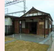
明和町観光パンフ レット作成事業