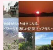
大湊歴史・防災 プロジェクト