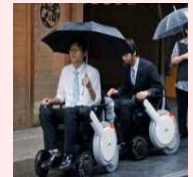
伊勢おもてなし ヘルパ-プロジェクト