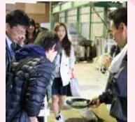
度会カフェリョク プロジェクト