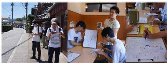
▲ 現地での防災まちあるき（8月27日）

今年度は、「避難訓練参加者増員プラン提案と避難訓練の運営」「おはらい町の「防災情報」「避難誘導情報」など、情報不足を解決するための提案」などを課題について、図上演習(7/12)や現地での防災まちあるき(8/27)を通じて検討しています。図上演習では、発災直後に自分たちがとりうる行動として携帯端末への依存度を議論しました。防災まちあるきでは、観光視点と、防災視点で見えてくる景色や意識の違いを実感しました。今後は、年度末に予定されている恒例の避難訓練へ向けて、学生の意見も反映しながら参加者増員を目指します。また、観光×防災ならではの平常時の情報発信にも挑戦してみたいと思います。