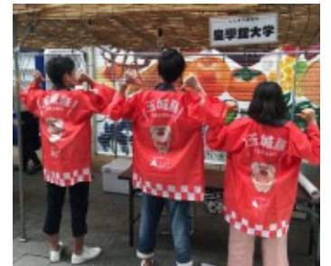
▼7月5日学内にて、熟成豚の試食会を実施。